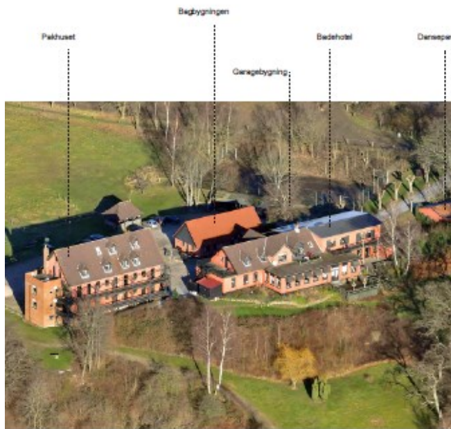
Skråfoto af Fakkegrav Badehotel før brand