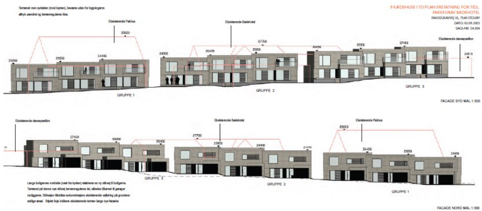
Facader nybyggeri - syd og nord